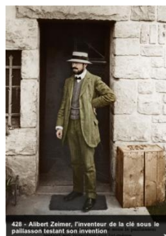
L'inventeur de la clé sous le paillason - Plonk et Replonk