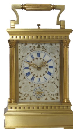
Pendulette Couaillet en ivoire